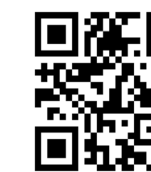
ExtremeCloud IQ 配套行動 應用程式入門