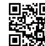
ExtremeCloud IQ 配套 Android 行動應用程式

使用您的行動裝置攝影機掃描序列號、擷取安裝影像、分配或更改裝置位置以及網路策略。ExtremeCloud IQ 配套行動應用程式使您能夠存取 CLI 裝置以進行故障排除並查看存取和客戶端狀態。