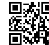
ExtremeCloud IQ 配套iOS 行動應用程式