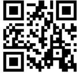
Aplicación móvil para iOS ExtremeCloud IQ Companion