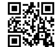
ExtremeCloud IQ 컴패니언 iOS 모바일 애플리케이션