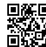
ExtremeCloud IQ 컴패니언 모바일 애플리케이션 온보딩