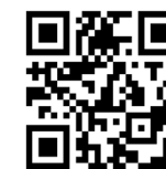
ExtremeCloud IQ 컴패니언 모바일 애플리케이션 온보딩