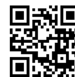
ExtremeCloud IQ 컴패니언 Android 모바일 애플리케이션

모바일 장치의 카메라를 사용하여 일련 번호를 스캔하고, 설치 이미지를 캡처하며, 장치 위치 및 네트워크 정책을 할당 또는 변경합니다. ExtremeCloud IQ 컴패니언 모바일 애플리케이션을 사용하면 장치 CLI에 액세스하여 문제를 해결하고 장치 및 클라이언트 상태를 볼 수 있습니다.