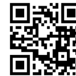
ExtremeCloud IQ 컴패니언 Android 모바일 애플리케이션

모바일 장치의 카메라를 사용하여 일련 번호를 스캔하고, 설치 이미지를 캡처하며, 장치 위치 및 네트워크 정책을 할당 또는 변경합니다. ExtremeCloud IQ 컴패니언 모바일 애플리케이션을 사용하면 장치 CLI에 액세스하여 문제를 해결하고 장치 및 클라이언트 상태를 볼 수 있습니다.